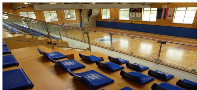
Športni dom Sevnica