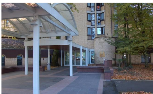
Lječilišni hotel Termal***