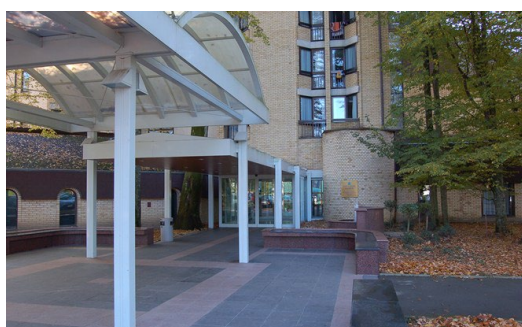
Lječilišni hotel Termal***